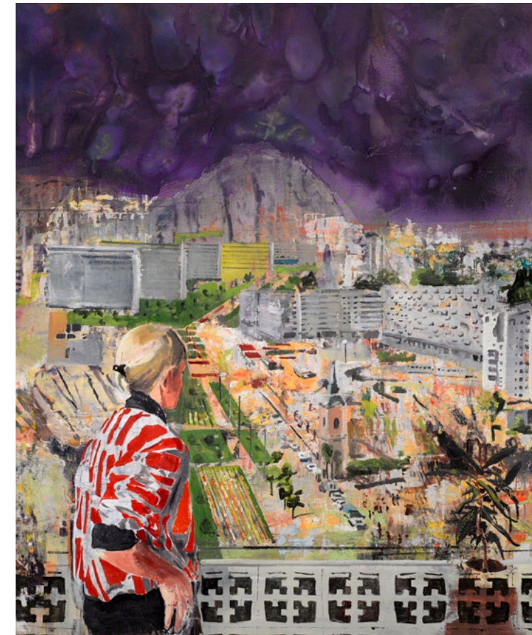
Modernism and after 2020 Oil on canvas 188.0 x 155.0 cm

“Transylfornia” is an infinite expanse of contrasting elements, encompassing the gradations that naturally occur between them. Although the space is based on Bercea's personal experience, there are universal questions inherent in it. In his smaller works, the viewer is confronted with the space as if entering into an intimate dialogue, while in his larger works, the viewer is swallowed whole.