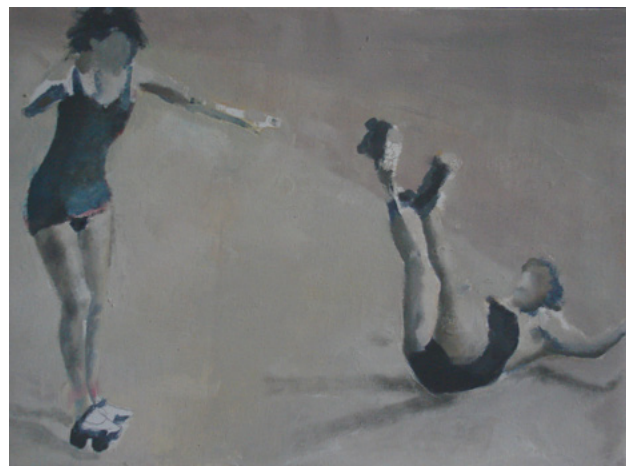
Denying gravity 2007 Oil on canvas 33.5 x 44.5 cm

ブルチーアの作品において、人間は、それを取り巻く環境との関係性の中で相対的に語られます。初期の作品では、匿名の人体とシンプルな背景の描写によって、人間の身体的・社会的な性質を浮き彫りにしています。その後、ブルチーアの作品には、特徴的なモダニズム建築が登場するようになります。ここでのモダニズム建築は、共産主義社会下で失敗に終わったユートピア的理念を表しており、その強い存在感が人物像と対比されることで、矮小化される人間の存在が強調されています。年を追うごとにより詳細になるブルチーアの人物描写ですが、特定の個人を表しているように見える人物像も、作家自身が「幽霊のような存在、あるいは、不在とさえいえる存在」と表現するように、やはり、個人としてのアイデンティティを持ちません。ブルチーアは、これらの誰でもない人物像を文脈上に配置することで、人間の有り様を人類学的視点で表しているのです。