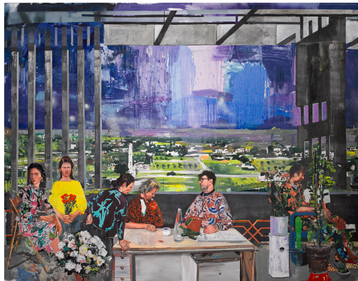
Bouquet of tender rhymes , 2020, oil on canvas, 300.0 × 400.0 cm