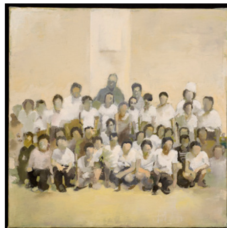
Visiting the hero's monument 2007 Oil on canvas 35.0 x 35.0 cm

The 1989 revolution brought down communism in Romania, and the austerity capitalism that followed created a clash of values. As a generation that has witnessed the turbulence of Romania, the artists of the Cluj School are dedicated to the study of Romanian history and artistic expression which inform their work. Marius Bercea, who experienced the Romanian Revolution at the age of 10 is no exception. Drawing on his own experiences and interpretations of Romanian history, Bercea's work explores historical contradictions and the nature of humans.