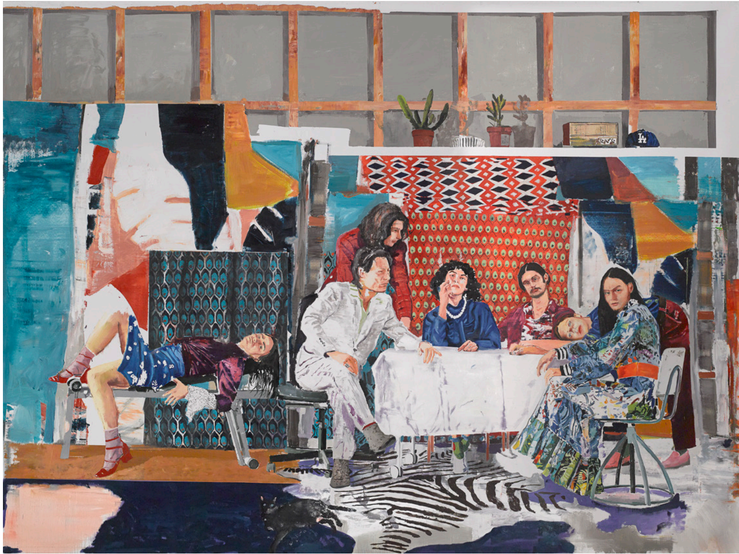
The far sound of cities , 2020, oil on canvas, 298.0 × 400.0 cm