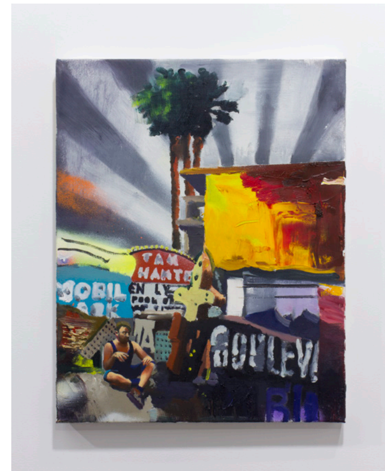
Appearance and Second Game 2016 Oil on canvas 50.2 x 40.0 cm